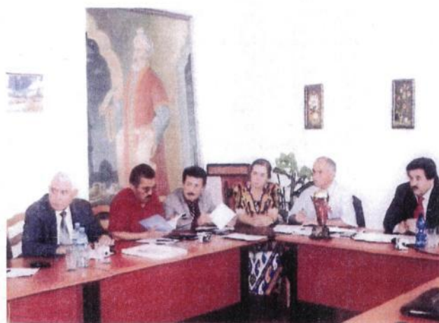
Пресс конференции в зале института